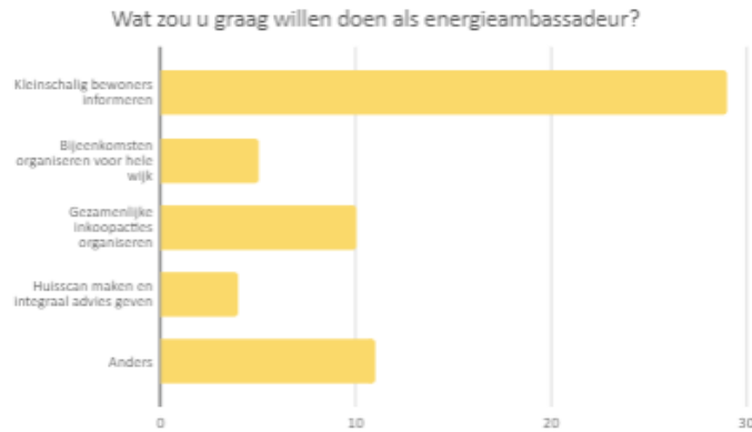
Tabel 2: Wat zou u graag willen doen als energieambassadeur?