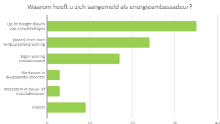
Tabel 1: Wat zou u graag willen doen als energieambassadeur?

In tabel 1 zijn de resultaten van vraag 1 weergegeven. Onder de categorie 'anders' werden verschillende alternatieven gegeven. Er is iemand die als ingenieur kennis heeft van energiebalans, materialen, technische oplossingen en voorwaarden en beperkingen. Er is iemand aanwezig die werkzaam is bij een woningcorporatie en iemand die bestuurslid is bij een vereniging van eigenaren. Ook is er iemand die lezingen geeft over de energietransitie. Uit navraag blijkt dat dit 'lezingen van globaal niveau' zijn en dus vrij algemeen zijn.